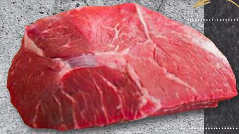
SHOULDER CLOD HEART BLACK ANGUS - ΣΠΑΛΑ ΚΕΝΤΡΟ