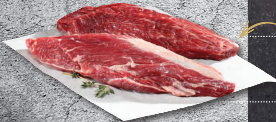
TERES MAJOR BLACK ANGUS USA-ΦΙΛΕΤΟ ΣΠΑΛΑ