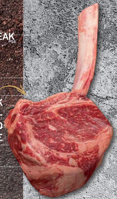
HEREFORD ΤΟΜΑΗΑΥΚ STEAK D/A 25D POL- ΣΠΑΛΟΜΠΡΙΖΟΛΑ Μ/Ο 25ΜΕΡΕΣ ΩΡΙΜΑΝΣΗΣ