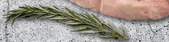
HEREFORD T-BONE STEAK D/A 25D POL-ΜΟΣΧΑΡΙ ΚΟΝΤΡΑ Μ/Ο Μ/Φ 25ΜΕΡΕΣ ΩΡΙΜΑΝΣΗΣ