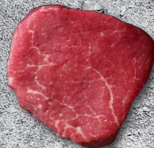
TENDERLOIN PSMO BLACK ANGUS - ΜΠΟΝ ΦΙΛΕ