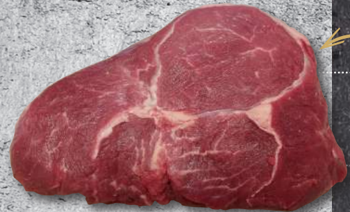
BALL TIP 2/UP BLACK ANGUS USA - ΜΑΤΙ ΣΤΡΟΓΓΥΛΟΥ