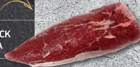
CHUCK TENDER BLACK ANGUS - ΣΠΑΛΟΜΙΤΑ