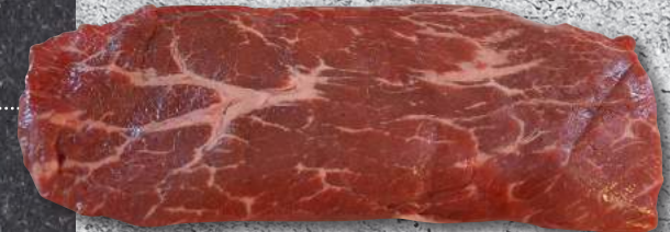
TOP BLADE MUSCLE BLACK ANGUS - ΧΤΕΝΙ