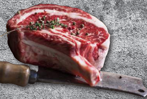
RIBEYE BONE IN - ΣΠΑΛΟΜΠΡΙΖΟΛΑ Μ/Ο