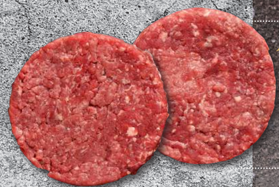
HEREFORD- ANGUS BURGER POL ΚΤΥ