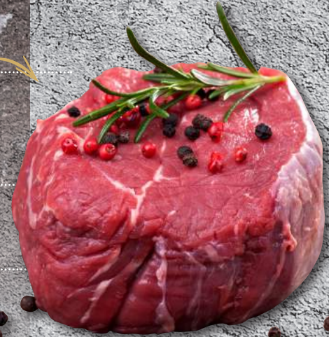
BRISKET JAPAN WAGYU