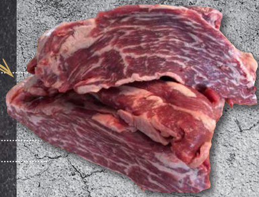
RIBEYE DRY AGED -ΣΠΑΛΟΜΠΡΙΖΟΛΑ Α/Ο ΞΗΡΗΣ ΩΡΙΜΑΝΣΗΣ